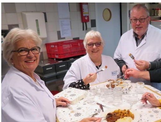
Jaarlijkse proeverij Kerst- en Nieuwjaars-menu's voor patiënten Beatrixziekenhuis

De leden uit de werkgroep Voeding zijn, al vanaf de voorbereidende fase in 2018, nauw betrokken bij de ontwikkeling van een nieuw voedingsconcept. Eind 2018 heeft de Cliëntenraad Beatrixziekenhuis een positief advies gegeven voor het nieuwe voedingsconcept. Door tussentijdse aanpassingen, de voortgang van de (ver)nieuwbouw en ICT afstemming tussen Chipsoft/Huuskes, is er vertraging ontstaan en is de introductie van het nieuwe voedingsconcept doorgeschoven naar 2020.